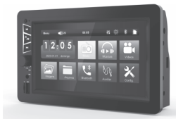
SVART - MP5 S600B 3062