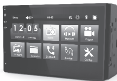
SVART - MP5 S600T 3063